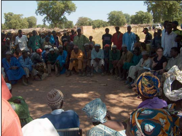
Dorfversammlung mit Dorfchef in N'Galamadibi

Ab Mai 2009 werden hier mit Hilfe der LAG Mali zwei solide Lagerhäuser für Getreide gebaut.