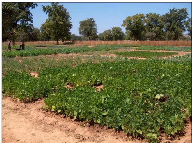
Auberginen und Zwiebeln gedeihen im Garten von Toulabougou

Im Nachbarort Djinidièbougou entsteht nach dem bewährten Konzept ebenfalls ein Garten von einem Hektar, der mit einem Maschendrahtzaun eingefriedet wird. Dort werden vorerst drei Brunnen zur Bewässerung der Gemüsepflanzen gegraben. Sie ermöglichen eine Verlängerung der Anbauperiode und damit eine Steigerung der Gemüseproduktion. 50 Frauen und 20 Männer, die den Garten bewirtschaften, erhalten Transportmittel zur Vermarktung, Arbeitsgeräte und Saatgut.