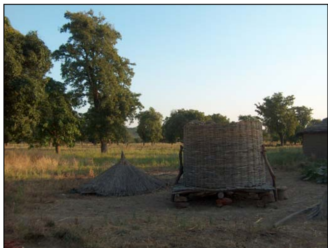
Traditioneller Getreidespeicher mit Dach links. I. Bild

Zusätzlich fällt diese Zeit der knappen Vorräte in die beginnende Regenzeit. Aufgrund ihrer geographischen Lage sind die Orte N’Galamadibi und Ouéssebougou-Awala durch einen überschwemmten Flusslauf von den anderen Dörfern regelrecht isoliert. Die Versorgung von außerhalb ist damit kaum möglich und es wird von Hungerperioden berichtet.